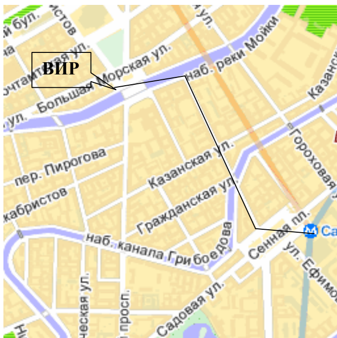
Карта С-Петербурга с маршрутом от станции метро «Чернышевская» до гостиницы ВИР – Саперный пр. д.7.