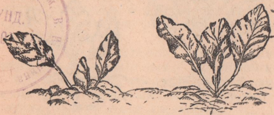
П о с а д к а р а с с а д ы Неправильная — слишком глубокая Правильная

В обильно политую лунку (в грязь) сразу же садят рассаду, причем почва должна быть плотно прижата к корням растений, после чего лунку присыпать сухой землею или перегноем во избежание образования корки и испарения влаги,