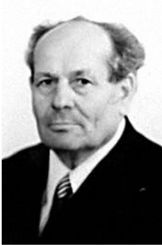
Рис 1. Портрет Нестерова Я.С