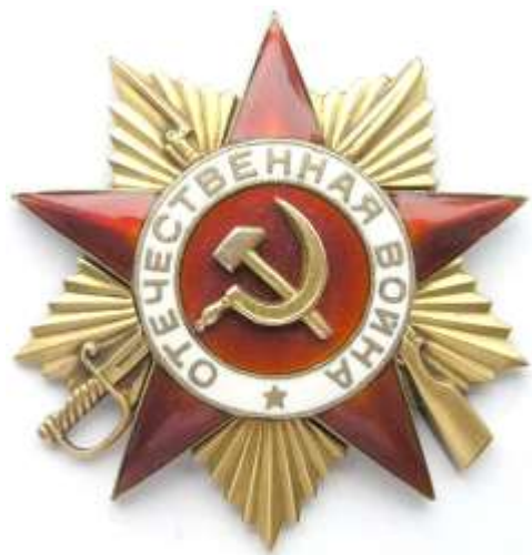
Орден «Отечественной войны» 1 степени