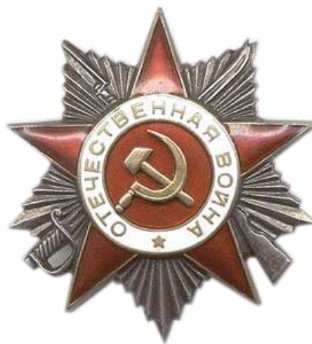
2 Ордена «Отечественной войны» 2 степени