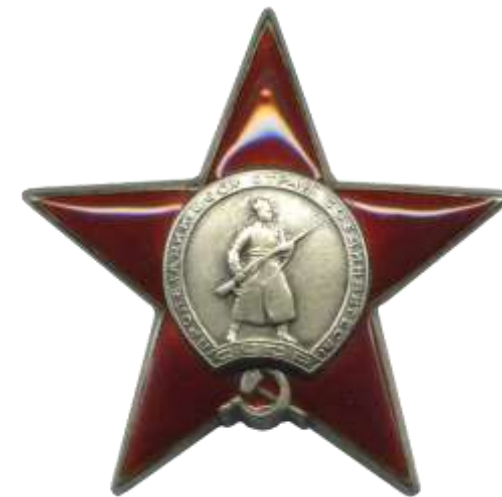
Орден «Красной Звезды»