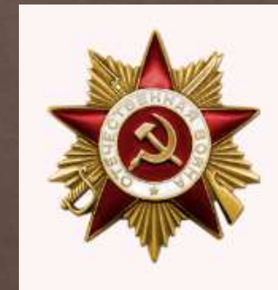
Орден Отечественной войны I степени