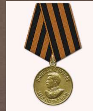
Медаль «За победу над Германией в Великой Отечественной войне 1941–1945 гг.»