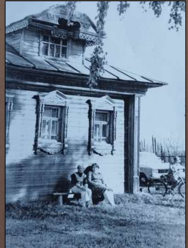
Дом В.Г. Тихомирова