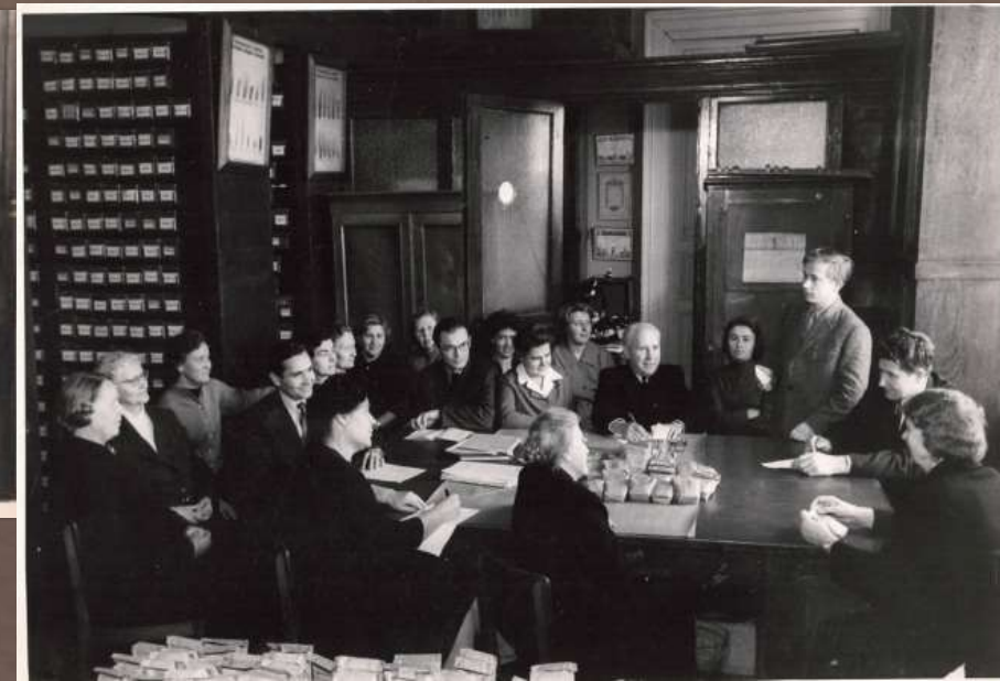
Собрание отдела зерновых культур ВИР