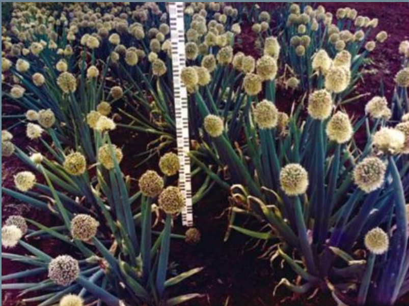
Лук-батун. Сорт 'Апрельский'