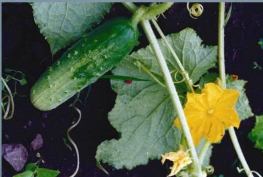
Огурец. Сорт 'Дальневосточный 6'