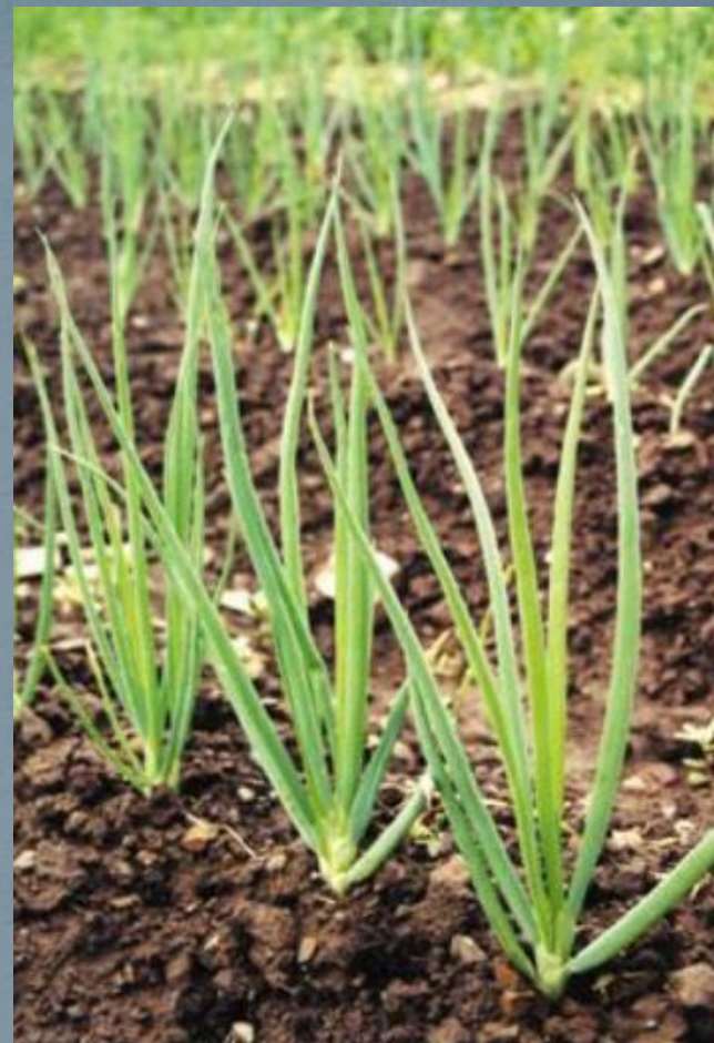
Лук батун. Сорт 'Майский'