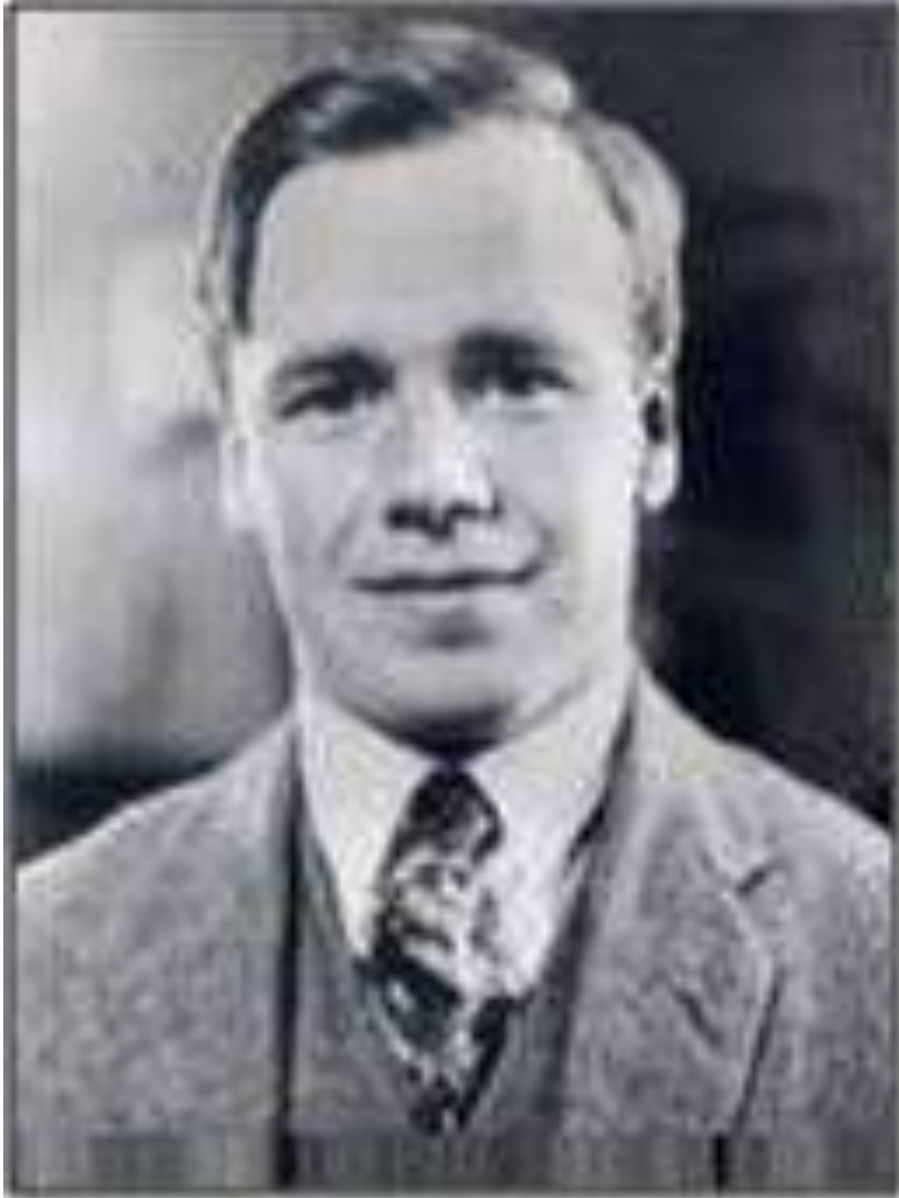
Георгий Дмитриевич Карпеченко (1899-1942)